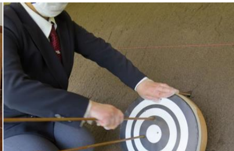
矢取りもマスク、ビニール手袋をつけることが望ましい