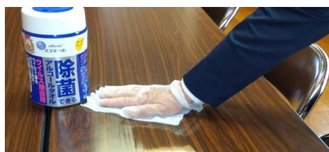
テーブルなどの除菌消毒