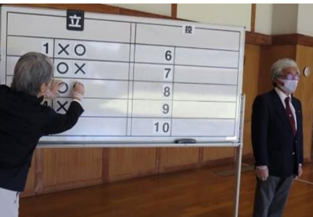
射場委員もマスク、ビニール手袋をつけることが望ましい