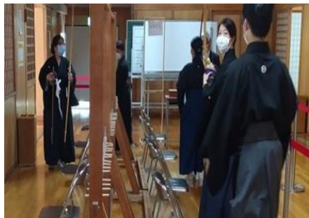
第2控から第1控に移動