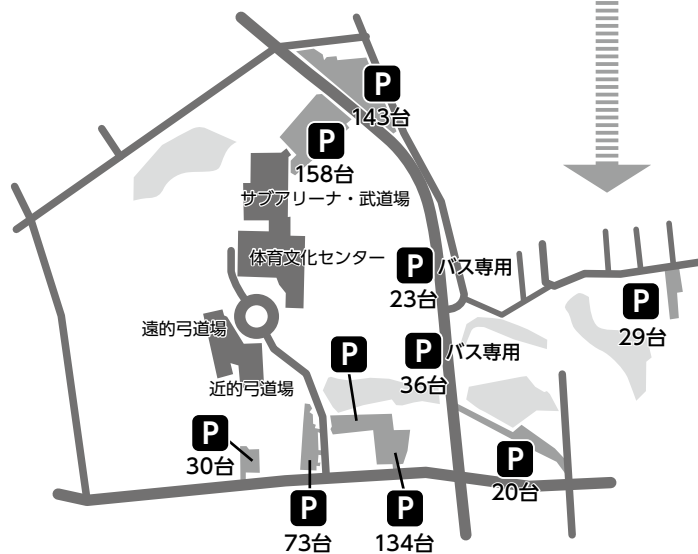
体育文化センター周辺地図

※〔都城〕特別臨時中央審査会実施要項については、別途(公財)全日本弓道連盟より各都道府県弓道連盟会長宛に送付されます。